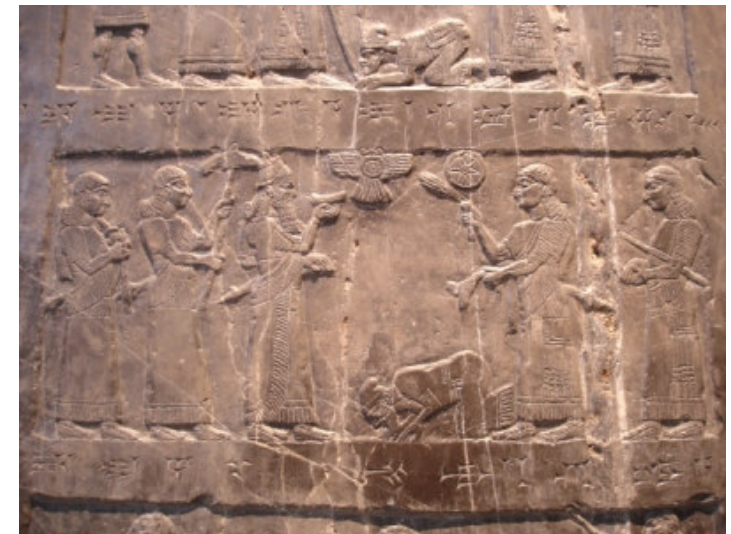
König Jehu wirft sich vor Salmanassar III. nieder. Bild vom Schwarzen Obelischen aus Nimrud, 9. Jh. v. Chr.